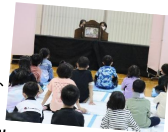
Story・ストーリー（よみきかせ）